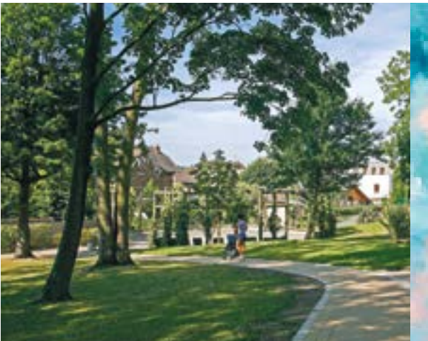
Parc du Bois Saint-Denis

Les amateurs de sport sont conquis par la présence d'une piscine et de plusieurs stades et gymnases, où ils peuvent pratiquer leurs activités favorites. Villiers-sur-Marne met la nature à l'honneur avec ses nombreux espaces verts, parcs et squares propices à la détente. Le Bois Saint-Martin promet quant à lui une grande bouffée d'air pur au fil de ses allées bordées d'arbres majestueux.