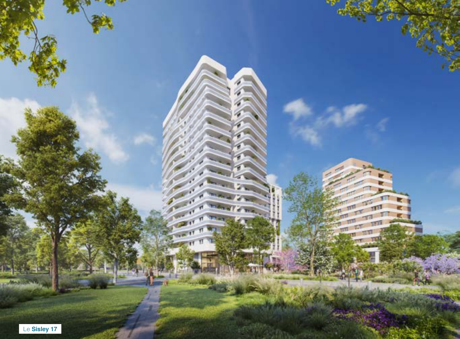
Le Sisley 17